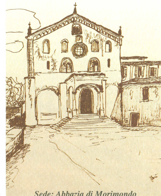
Sede: Abbazia di Morimondo